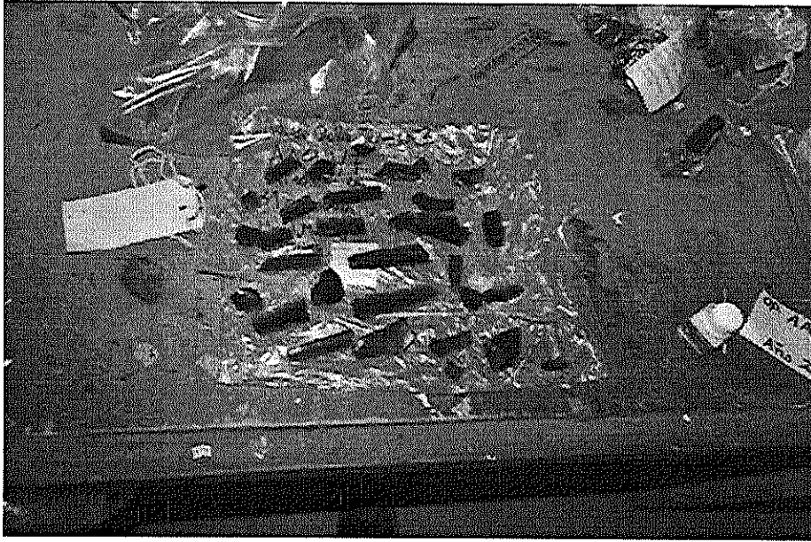
Ilustración 2. Marcaje de artefactos de obsidiana.